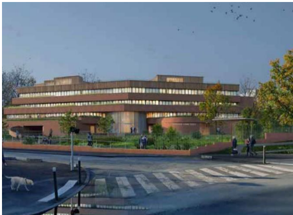
Perspective - Projet Canal architecture