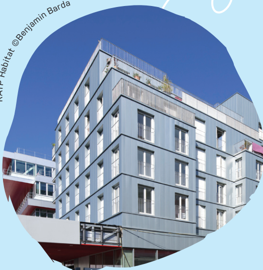
RATP Habitat

Grand propriétaire foncier à la tête de 700 hectares en Île-de-France, le Groupe RATP s'appuie sur sa filiale immobilière sociale, RATP Habitat, pour transformer une contrainte en opportunité. L'organisme construit des logements destinés à loger ses travailleurs essentiels en superposition/surélévation au-dessus de centres de bus, de stations de métro ou de trams. Objectif : avoir construit plus de 2 000 logements d'ici à 10 ans, dont la moitié de logements sociaux. À la clé : optimisation foncière, prise en compte des contraintes spécifiques de la ville, qualité architecturale et durabilité.