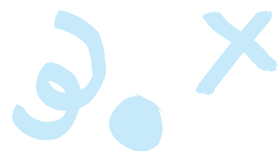
Antin Résidences