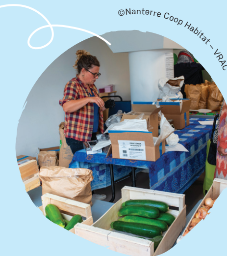
@Nanterre Coop Habitat - VRAC

Le projet VRAC vise à faciliter l'accès à une alimentation durable pour les résidents habitant en Quartiers Politique de la Ville (QPV) en proposant des solutions qualitatives, écologiques et accessibles. En Île-de-France, VRAC représente 15 groupements d'achats, plus de 1 600 foyers adhérents et 90 tonnes de denrées alimentaires achetées (chiffres 2024). À Nanterre, VRAC totalise quelque 165 familles adhérentes, soit plus de 500 personnes (chiffres juillet 2025). Un partenariat a été mis en place par Nanterre Coop Habitat avec le centre social et culturel La Traverse pour mener à bien les distributions aux locataires. Un