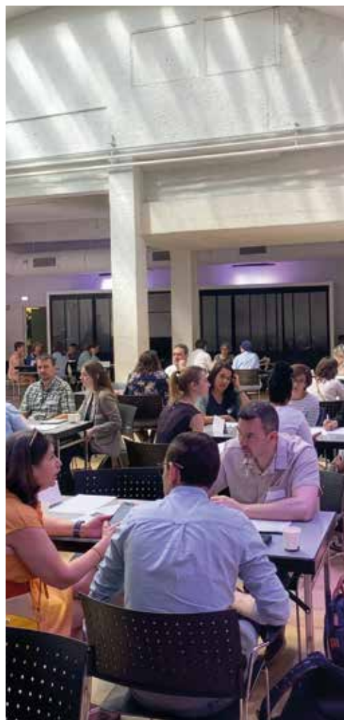
→ Hlm accompagnés : speed-meeting entre organismes de logement social et associations, 10 juillet 2025.