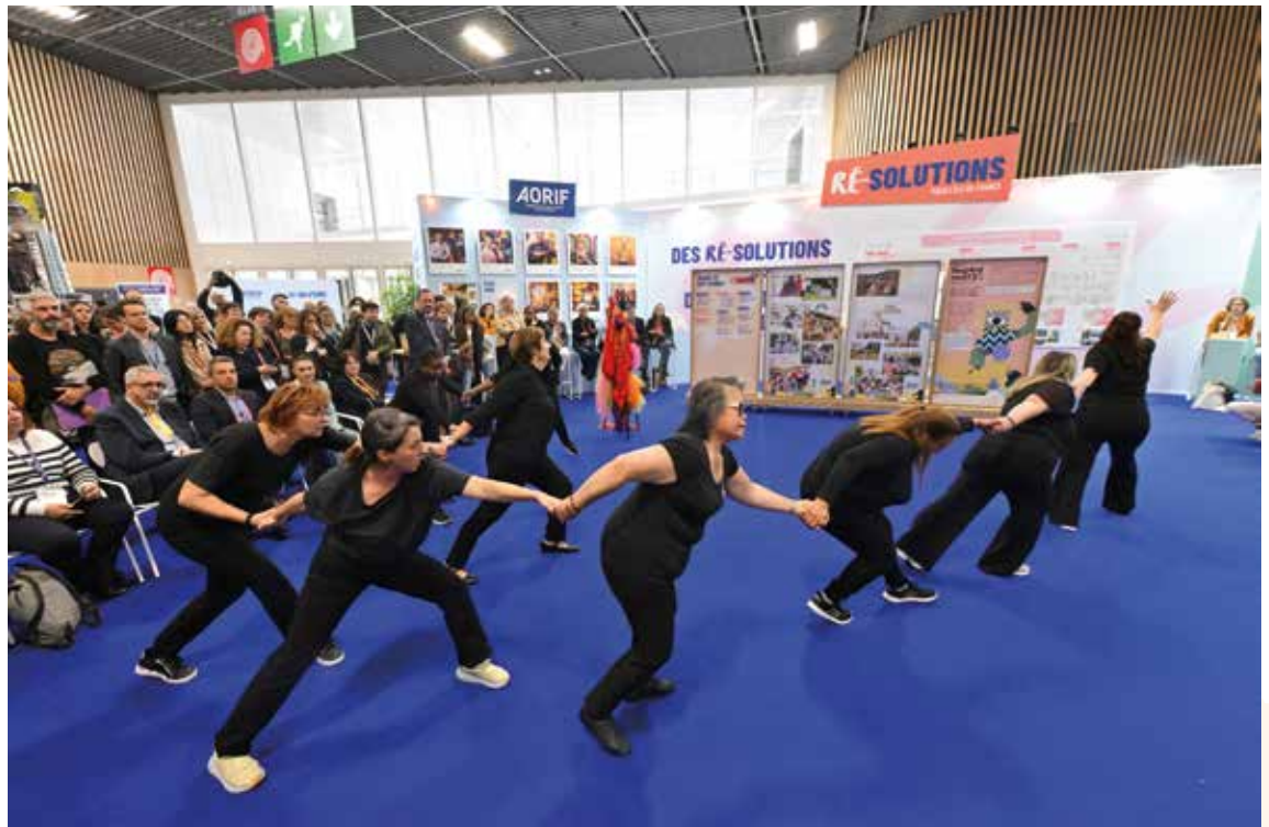
→ Restitution du projet de danse « La vie mode d'emploi » créé avec Chaillot Théâtre national de la Danse et des habitantes de Noisy-le-Grand.