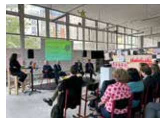
→ Séance de travail de l'Atelier des solutions le 25 mars 2025.

économique, l'image du logement social, les processus administratifs et l'accès au foncier. L'AORIF porte plus particulièrement les travaux concernant le modèle économique. Objectif : trouver comment réduire les coûts globaux de construction, de l'acquisition du foncier jusqu'à celui de l'entretien, en mobilisant des formes juridiques peu mises en œuvre à ce jour. Pour l'ensemble des solutions, il s'agit désormais de constituer des partenariats opérationnels pour tester les hypothèses retenues.