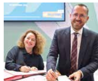
→ Signature du nouvel accord de partenariat DRAC-AORIF au Congrès Hlm 2025.