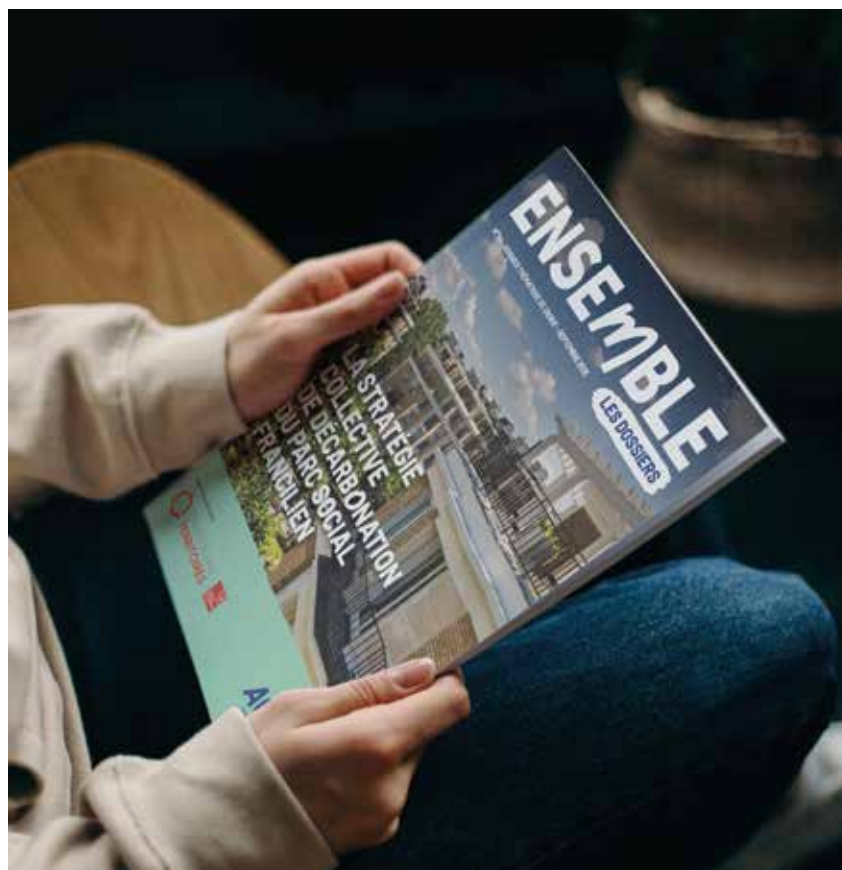
→ « La stratégie inter-organismes de décarbonation du parc social francilien » (Dossier d'Ensemble n°34), à télécharger sur aorif.org .

... Dans cette perspective, l'inter-organismes yvelinois s'est rapproché de l'équipe du Service intégré d'accueil et d'orientation (SIAO) du département afin de travailler sur les enjeux de fluidité, et plus particulièrement sur la labellisation des publics prioritaires. Cette dynamique a débouché sur des formations sur les CALEOL et des notes sociales à destination des travailleurs sociaux des structures d'hébergement. Ces formations, animées par l'AFFIL, avec l'appui de l'AORIF et du service attributions d'un bailleur social, visent une meilleure compréhension des attentes des services instructeurs des bailleurs sociaux concernant les dossiers de demandes de logement social des ménages hébergés. Des échanges sont également en cours autour de l'organisation d'un « Forum Logement » visant à multiplier les occasions de rencontres entre bailleurs et structures d'hébergement. Ce fut également le rôle joué par le premier « speed-meeting » dans le cadre de l'appel à projets « Hlm accompagnés », organisé par la DRIHL et l'AORIF afin