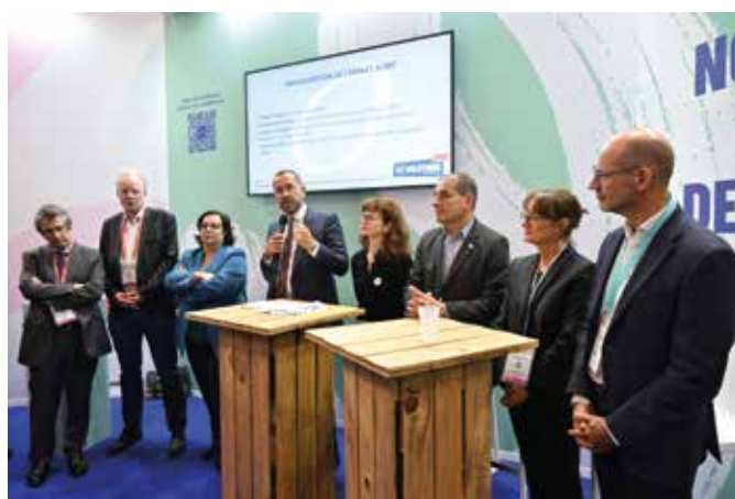
→ Inauguration de l'espace AORIF au Congrès le 23 septembre 2025.