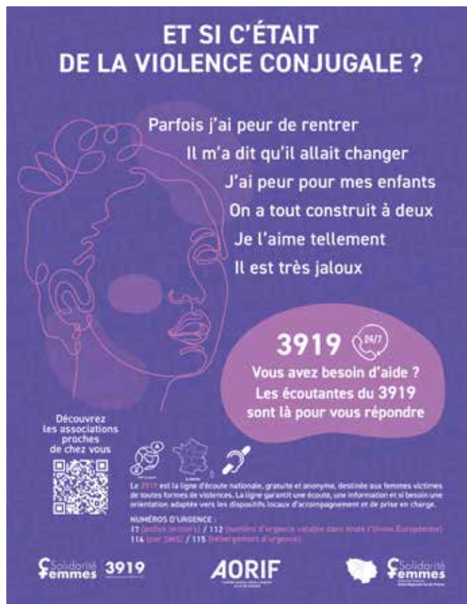
→ Affiche de sensibilisation au sujet des violences faites aux femmes, faisant partie du kit de communication téléchargeable sur aorif.org.

> Renforcer l'acculturation commune sur les questions liées au vieillissement et favoriser la prévention des risques auprès des locataires du parc social ;