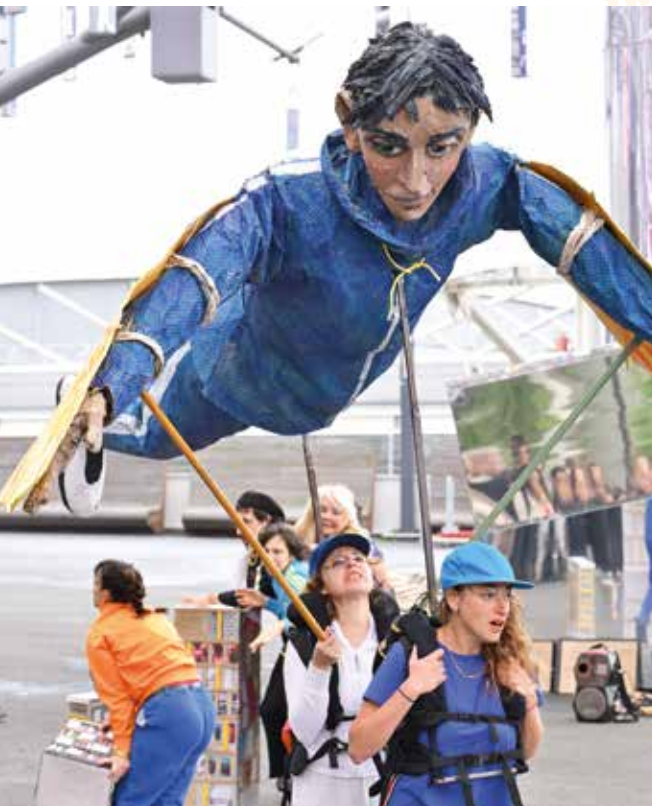
→ Représentation du spectacle « Dédale idéal, des dalles idéales », une création de la compagnie La Générale de Théâtre.