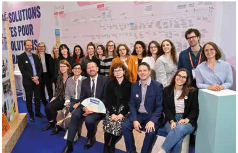
→ L'équipe et le président de l'AORIF au Congrès Hlm 2025.