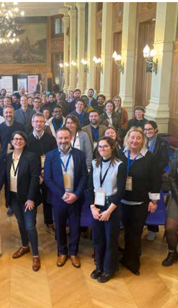
→ Convention d'affaires « Achetez engagé ! » organisée par l'AORIF le 2 avril 2025 en partenariat avec l'ADEME Ile-de-France et la Chambre régionale de l'économie sociale et solidaire (CRESS).