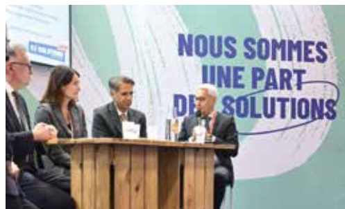
→ Table ronde sur les expérimentations territoriales en Ile-de-France au Congrès Hlm 2025.

Directeur de la Direction régionale et interdépartementale de l'Hébergement et du Logement (DRIHL)