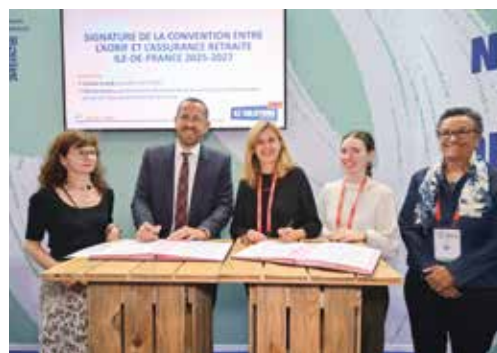
→ Signature de la nouvelle convention de partenariat entre l'AORIF et l'Assurance retraite Ile-de-France au Congrès Hlm 2025.

> Adapter l'offre de logements pour répondre au plus près des besoins des seniors ;