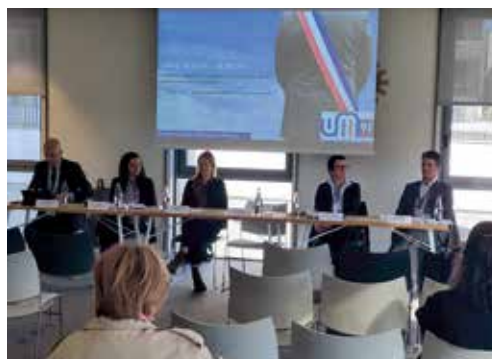
→ Université des mairies de l'Essonne, 10 avril 2025.

Après un webinaire de sensibilisation aux achats responsables en février 2025, l'AORIF a inauguré en avril un nouveau format d'événement avec la convention d'affaires « Achetez engagé ! », organisée en partenariat avec l'ADEME Ile-de-France et la Chambre régionale de l'économie sociale et solidaire (CRESS) Ile-de-France. Table-ronde sur les politiques d'achats responsables avec ICF Habitat et l'Union sociale pour l'habitat, stands de partenaires, sans oublier des rendez-vous d'affaires entre bailleurs et fournisseurs locaux... Les organismes Hlm ont pu enrichir leurs pratiques d'achats. Chacun des douze bailleurs présents a bénéficié de six rendez-vous avec des entreprises porteuses de solutions vertueuses. Cet événement plébiscité par les participants, bailleurs comme fournisseurs, a souligné la volonté partagée du tissu économique local et des organismes de logement social à travailler ensemble pour mener la transition écologique du secteur Hlm.